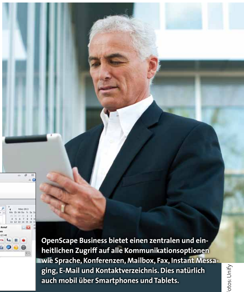
OpenScape Business bietet einen zentralen und einheitlichen Zugriff auf alle Kommunikationsoptionen wie Sprache, Konferenzen, Mailbox, Fax, Instant Messaging, E-Mail und Kontaktverzeichnis. Dies natürlich auch mobil über Smartphones und Tablets.

Der Schlüssel zur Optimierung liegt in der Vernetzung Ihrer Unternehmenskommunikation über eine Lösung, mit der Sie ohne Medienbrüche Ihren Mitarbeitern, Geschäftspartnern und Kunden direkte und unkomplizierte Kommunikation bieten und gleichzeitig Kosten reduzieren können.